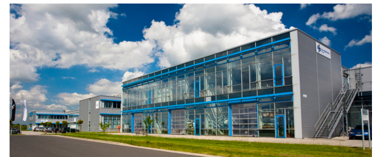
Gebäude der Neue Materialien Bayreuth