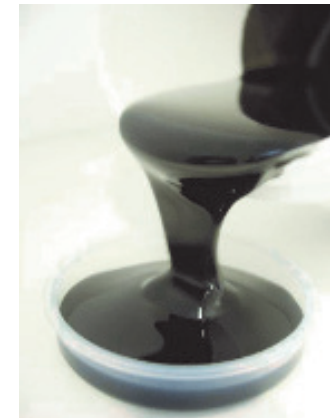
Abbildung: eine mit Carbon Nanotubes versetzte Epoxidharz-Dispersion